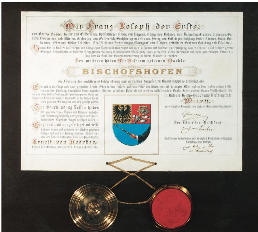
(li.) Verleihungsurkunde anlässlich der Markterhebung von Bischofshofen am 9. Februar 1900. Das Bischofshofener Wappen wurde hier erstmals offiziell verwendet.

Bis ins 19. Jh. war Bischofshofen bestimmt von einer kleinbürgerlich-bäuerlichen Wirtschaftsstruktur. Der Bahnbau mit der Eröffnung der "Giselabahn" (Salzburg - Bischofshofen - Wörgl) und der "Kronprinz-Rudolf-Bahn" (Richtung Radstadt) im Jahr 1875 brachte den Umschwung: Am 9. Februar 1900 wurde die Ortschaft Bischofshofen aufgrund der "gewerblichen Entwicklung" von Kaiser Franz-Joseph zum Markt erhoben. Eisenbahn und Kupfergewinnung waren zu diesem Zeitpunkt Hauptträger der Wirtschaft.