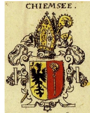
(o.) Das Wappen des Bistums von Chiemsee (nach Siebmachers Wappenbuch von 1605)