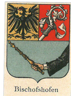
(o.) Darstellung des Wappens in der Ausgabe „Städte- und Gemeindegewappens von Österreich-Ungarn“ im Jahr 1904