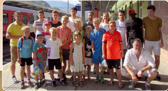
Bilder: Jugendtreff Liberty, Seniorenheim, Krabbelgruppe