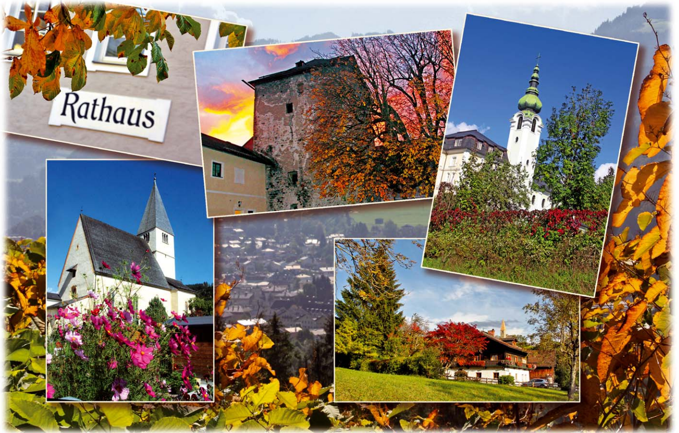
Herbststimmung in Bischofshofen