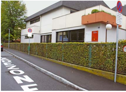
Die neue »Ladezone« für Eltern vor der BAKIP

Eine grundlegende Aufgabe der Stadtgemeinde ist die Erhaltung und Verbesserung der Infrastruktur. Daher wurden auch in diesem Jahr wieder zahlreiche Bau- und Sanierungsmaßnahmen durchgeführt. Je nach Bedarf wurden die Straßenoberfläche und -beleuchtung, Kanal- bzw. die Wasserleitung saniert. Zudem wurde im Zuge der Bauarbeiten die Infrastruktur der Salzburg AG und Telekom teilweise erneuert. Mit den Sanierungsarbeiten wurde im April 2015 begon-