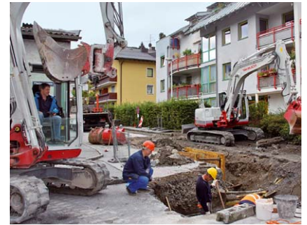
Bauarbeiten in der Alten Bundesstraße

Derzeit werden noch Sanierungsarbeiten in der Alten Bundesstraße – vom Feuerwehrhaus bis zur Kreuzung Bodenlehenstraße – durchgeführt. Dabei werden zur Verkehrsberuhigung auch zusätzliche Parkplätze mit Grüninseln angeordnet. Abgeschlossen sind die Bauarbeiten Mitte November.