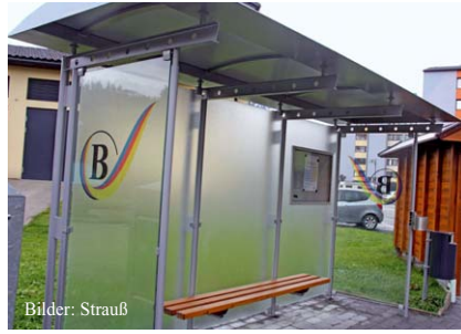
Adaptierte Busstation in der Salzburger Straße

Eine grundlegende Aufgabe der Stadtgemeinde ist die Erhaltung und Verbesserung der Infrastruktur. Daher wurden auch in diesem Jahr wieder zahlreiche Bau- und Sanierungsmaßnahmen durchgeführt. Je nach Bedarf wurden die Straßenoberfläche und -beleuchtung, Kanal- bzw. die Wasserleitung saniert. Zudem wurde im Zuge der Bauarbeiten die Infrastruktur der Salzburg AG und Telekom teilweise erneuert. Mit den Sanierungsarbeiten wurde im April 2015 begon-