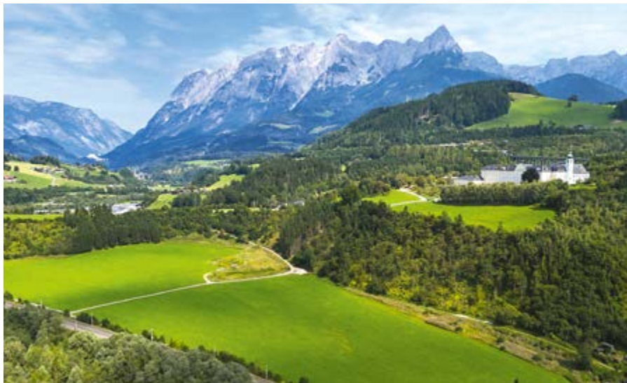
Der Lackenhof am Fuße des Miassionshauses St. Rupert

mehr Raum für Bewegung, Sport und Erholung zu bieten – und damit die Attraktivität der Stadt nachhaltig zu steigern. Die Kauffläche entspricht exakt dem Projektplan eines Sportzentrums, welches aktuell aus wirtschaftlichen