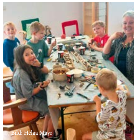
Arbeiten mit Stein und Holz im Kunstquadrat