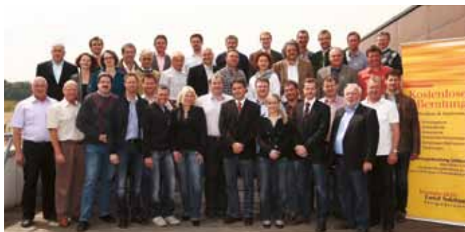
Das Team der Energieberatung